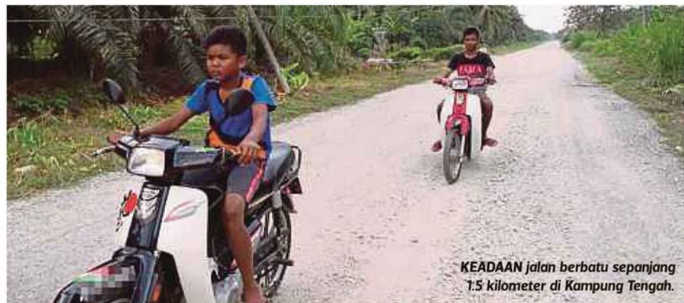
KEADAAN jalan berbatu sepanjang 1.5 kilometer di Kampung Tengah.

"Sebelum ini, keadaan jalan tidak bermasalah. Tetapi, segalanya berubah selepas diperbaiki.