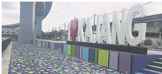
竖立在加影滨河花园冷岳河岸的“I LOVE KAJANG”地标，因地点不适中，相信无法吸引民众“打卡”。

“早前，我们已把加影7个历史走道的建议书呈给市议会，要求在相关地点设立告示牌，但市议会也没咨询我们的意见。”