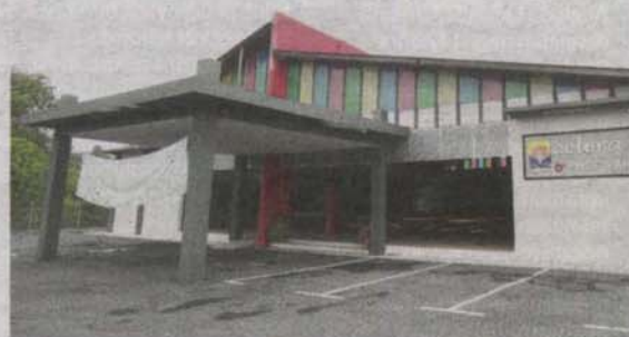
KAWASAN medan selera D' Pinggir antara tempat anjing liar berteduh di Desa Pinggir Putra.

Dalam isu ini, PBT yang bertanggungjawab iaitu Majlis Perbandaran Sepang (MPSepang) perlu mengambil tindakan yang lebih berkesan bagi mengelak perkara tidak diingini berlaku dan difahamkan MPSepang sememangnya sentiasa melaku-