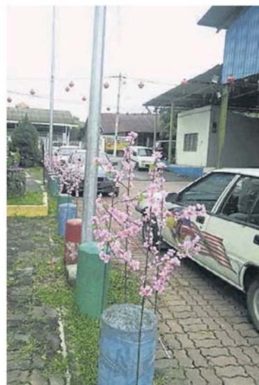
村委会用桃花装饰新村。

有关庙会将于2月17日早上9时至下午2时，在曼达岭街（Jalan Mendaling）老街广场举办，届时有30多个美食与文化摊位，欢迎民众一起来感受庙会热闹气氛。