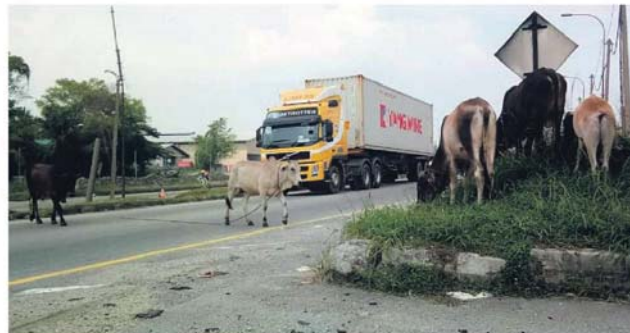
Lembu berkeliaran membawa padah kepada pemandu dan haiwan terbabit.

Hafizi berkata, penunggang motosikal antara yang