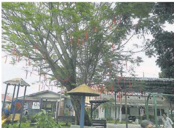
錫米山新村籃球賽多了一棵許願樹。