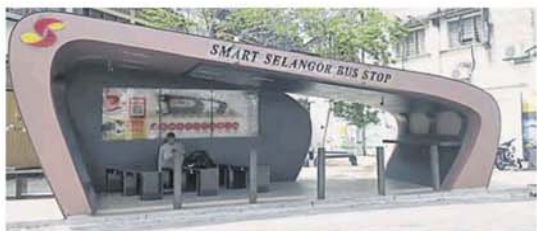
精明巴士候车亭建起后，口袋公园和壁画被“藏”在后面。