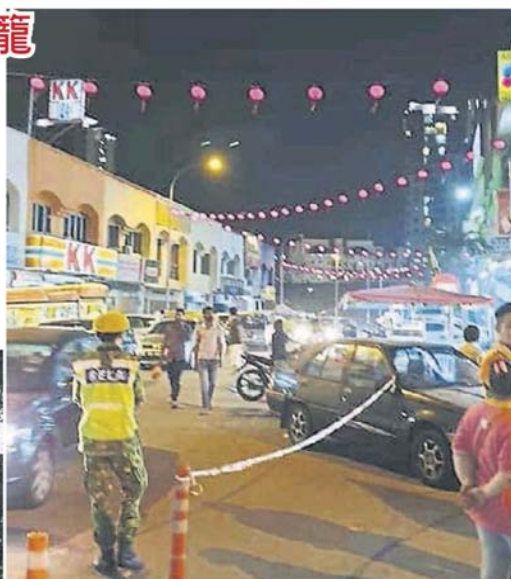
配合大团拜，锡米山大记茶室外面上挂上红灯笼。

在这浓厚的佳节气氛里，大家就不要每天都窝在棉被里睡到日上三竿，快来看看雪隆地区有什么好玩好逛的！