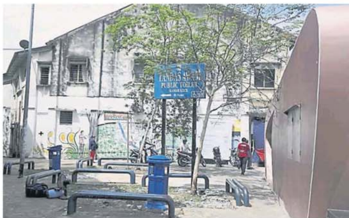
“口袋公园”被巨大的精明巴士候车亭遮盖了。